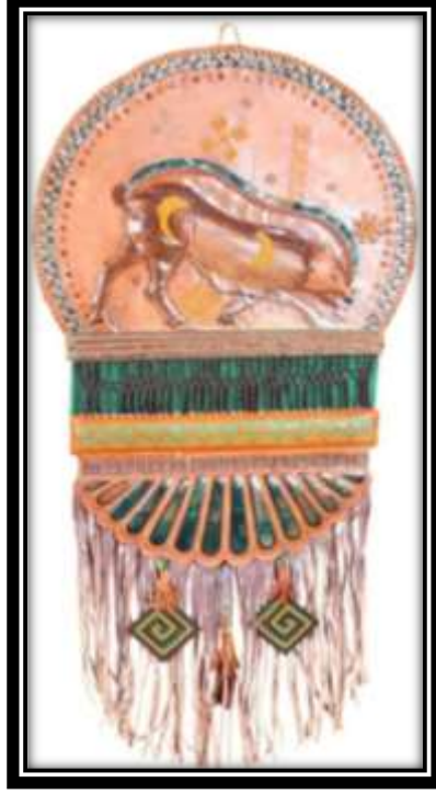
شكل رقم (٦) معلقة من تنفيذ الدارسة

المشغولة من إتران التصميم إلى جانب التنوع والتباين في التقنيات المستخدمة في العمل الفني .