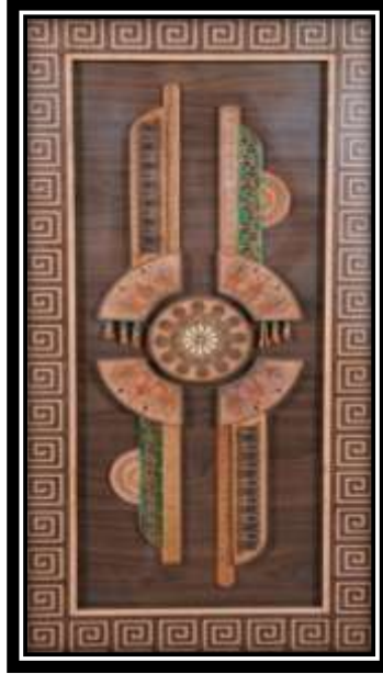
شكل رقم (٧)

أسلوب التركيب والتجميع فى تلك المشغولة لإبراز جمال الشكل عن طريق تجميع قطع الجلد فوق بعضها بمقاسات مختلفة وبمستويات مختلفة بإستخدام شرائح الأبلاكاش للتجسيم ولإظهار جماليات الزخارف وتم عن طريق الجمع بين هذه التقنيات المختلفة والتوافق فى إستخدام الالوان والخامات لإبراز جمال تصميم المشغولة ، بما يحتويه على تفاصيل أدت إلى إبراز جمال المشغولة من خلال الخامات المختلفة ،فهذا الإندماج أدى الى إثراء هذا العمل وخلف نوعاً من الثراء التشكيلي للعمل الفنى فظهر الإتزان فى المشغولة من إتزان التصميم إلى جانب التنوع فى التقنيات المستخدمة فى العمل الفنى والتباين فى المستويات