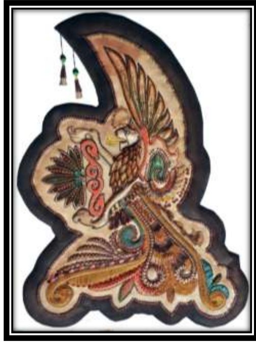
شكل رقم (٥) معلقة من تنفيذ الدارسة